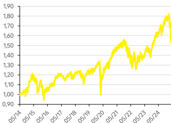
Vývoj hodnoty fondu Strategy 75